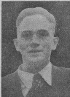
HUSS Nic., Stolzeburg gefall zu Ro'sport am August 1945