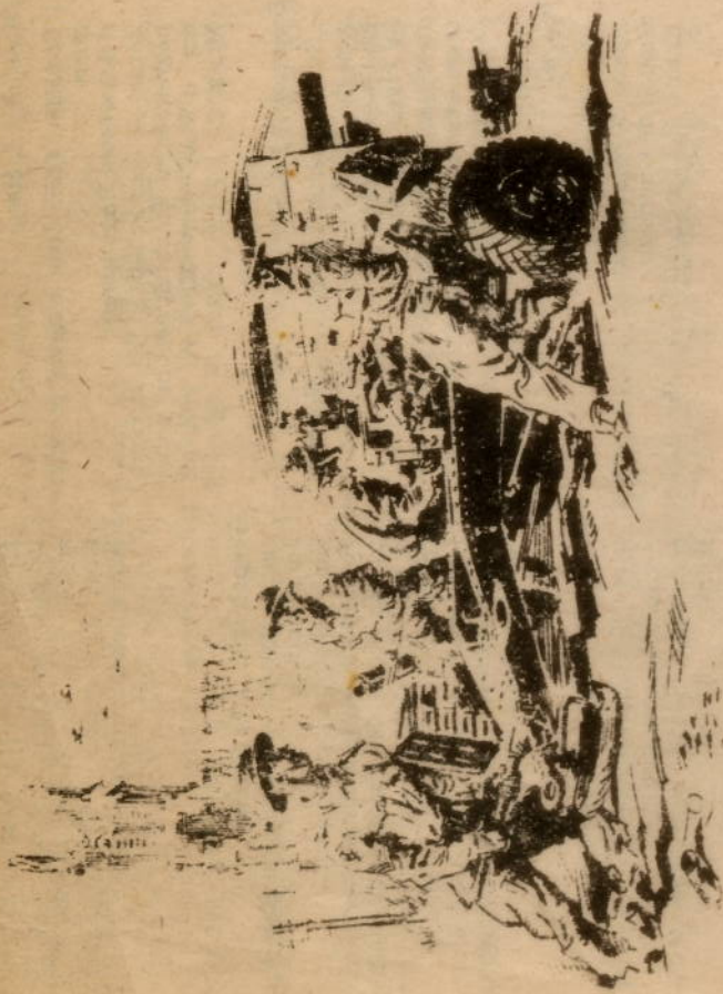
Batterie luxembourgeoise en action

dans Villers-sur-Mer. A chaque fenêtre flotte un drapeau, dans chaque bouche retentit le même cri, dans chaque cœur se reflète la même joie. Nous sommes acclamés en libérateurs, on nous em-