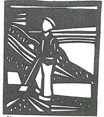
Maenoldal um 1920/30 Papenburg a. H.

Postfach 1132 Wiek rechts 22 D-2990 Papenburg Tel. (0 49 61) 49 71