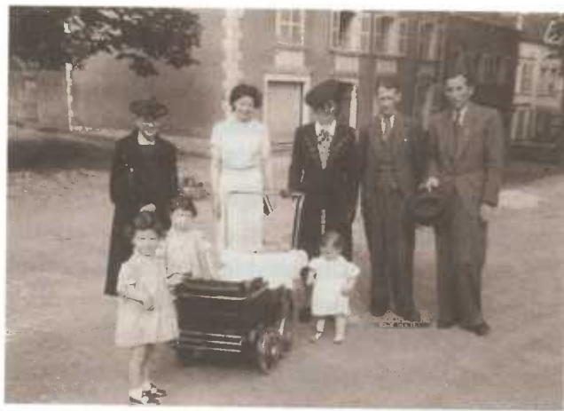
Mee 1945 op der Plaz vum alen Tuur (Méchelsplaz) zu Miersch

Et war d'Rundstedt-Offensiv. Dovu wosste mir nëmmen, wa mer emol an de Kino gaange sinn. Do hu mir Veianen gesinn an och eng Kéier Iechternach, awer mir wossten net, wat ass dann elo nach vu Miersch do.