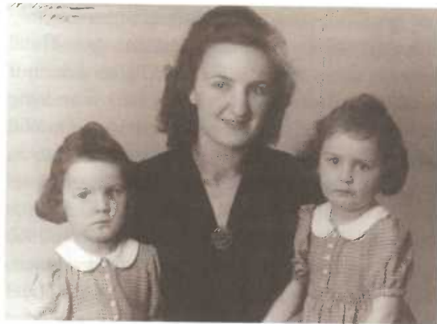
1945, 3 Méint no der Ëmsiedlung