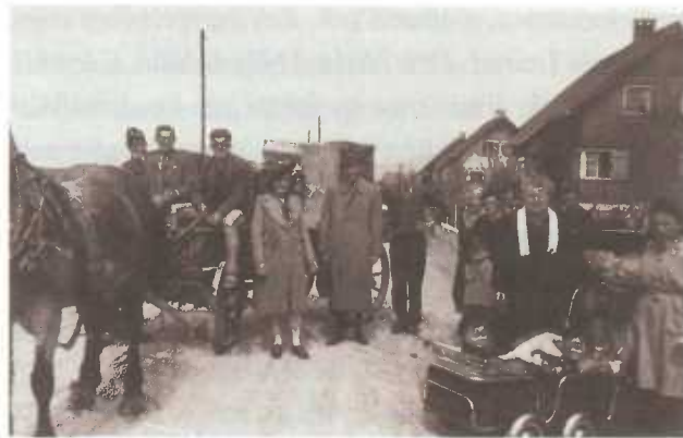
De 26.4.1945: Et geet endlech heem!

26.4. Le jour se lève, notre grand jour ... Dat war déi lescht Nuecht ënnert de Preisen! (...) Endlech si mer do, zu Fouss, no 20 Minutten. Mir gi bei de Stacheldrot, do stung jo nit eisen Här vun der Gestapo aus der Villa Muttern. „Ihr kommt nicht rüber“. Ech soen him klipp a klor, dass mir et versprach kritt hu gëschter um Landrat. Wéi mer eis geiergert hunn, koum de Schwäizer Oberleutnant bei