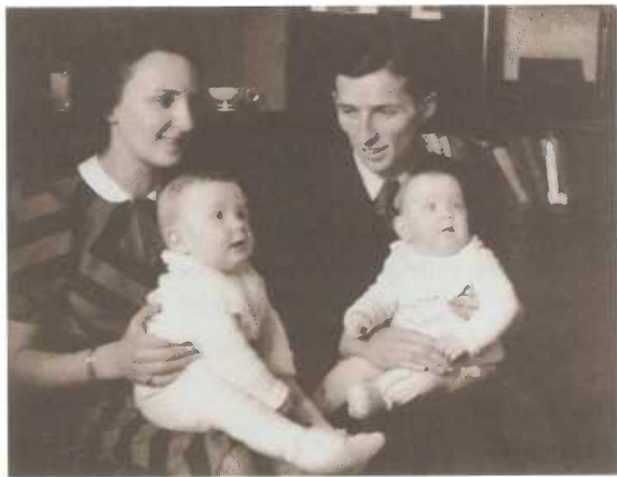
Eng nach glécklech Familljen am Dezember 1942

„Jooo, ech niere se ...“ Ech hat bal e Schlag kritt! Ech hunnt direkt geduecht, den Dokter an d’Hiewan hunnt dir net alles gesot, wat bei der Geburt geschitt war.