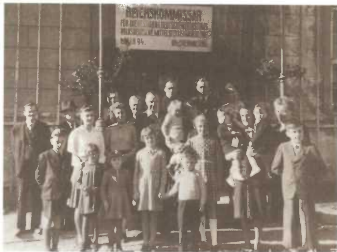
D'Stube 1 zu Wallisfurth am Lager am Oktober 1943

Am Lager ware „Stuben“, Stube 1, 2, 3 an esou weider. An uewenop do war eng Stube, wou 56 Leit waren. D'Better waren iwwereneen, si ware fir zwou Persounen, an et ass ee mat enger Träppchen eropgaangen. Et waren eigentlech e bësse méi breet Eenzelbetter, an uewen deemno och. Déi, déi e bëssen