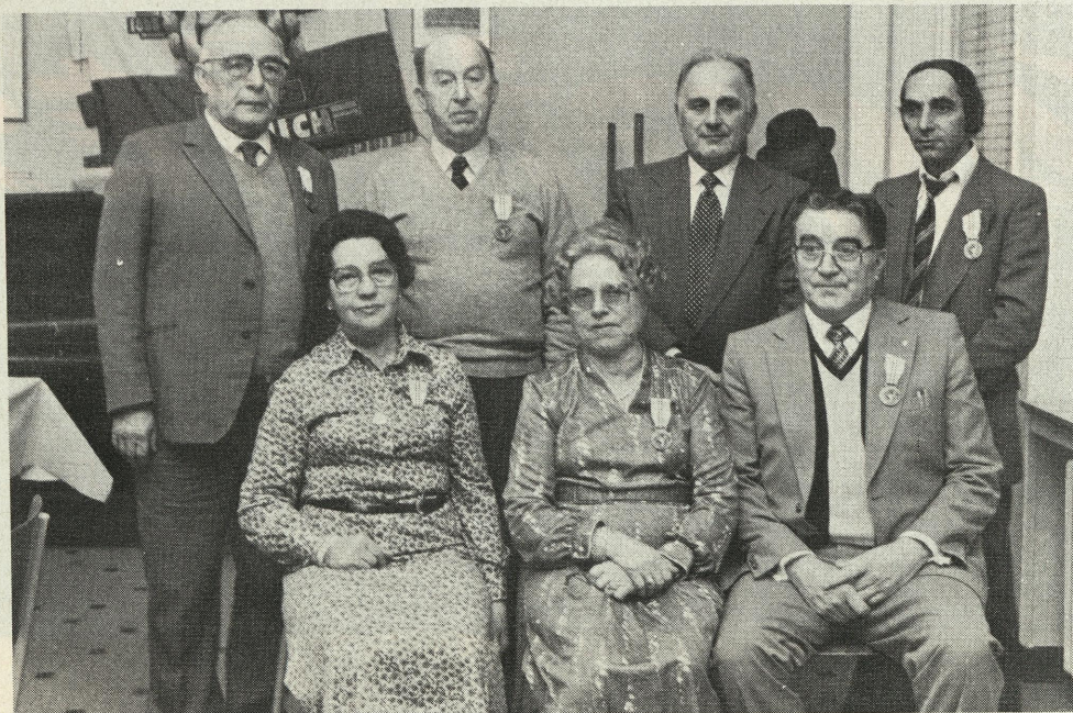
Texte et photo: Arsène KRAUS 1, rue Charles Martel Luxembourg