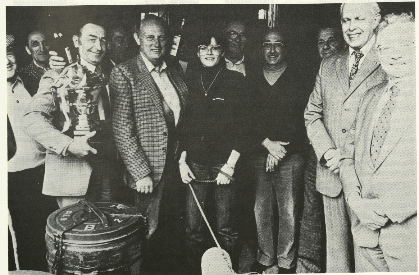
1981, No 10/11