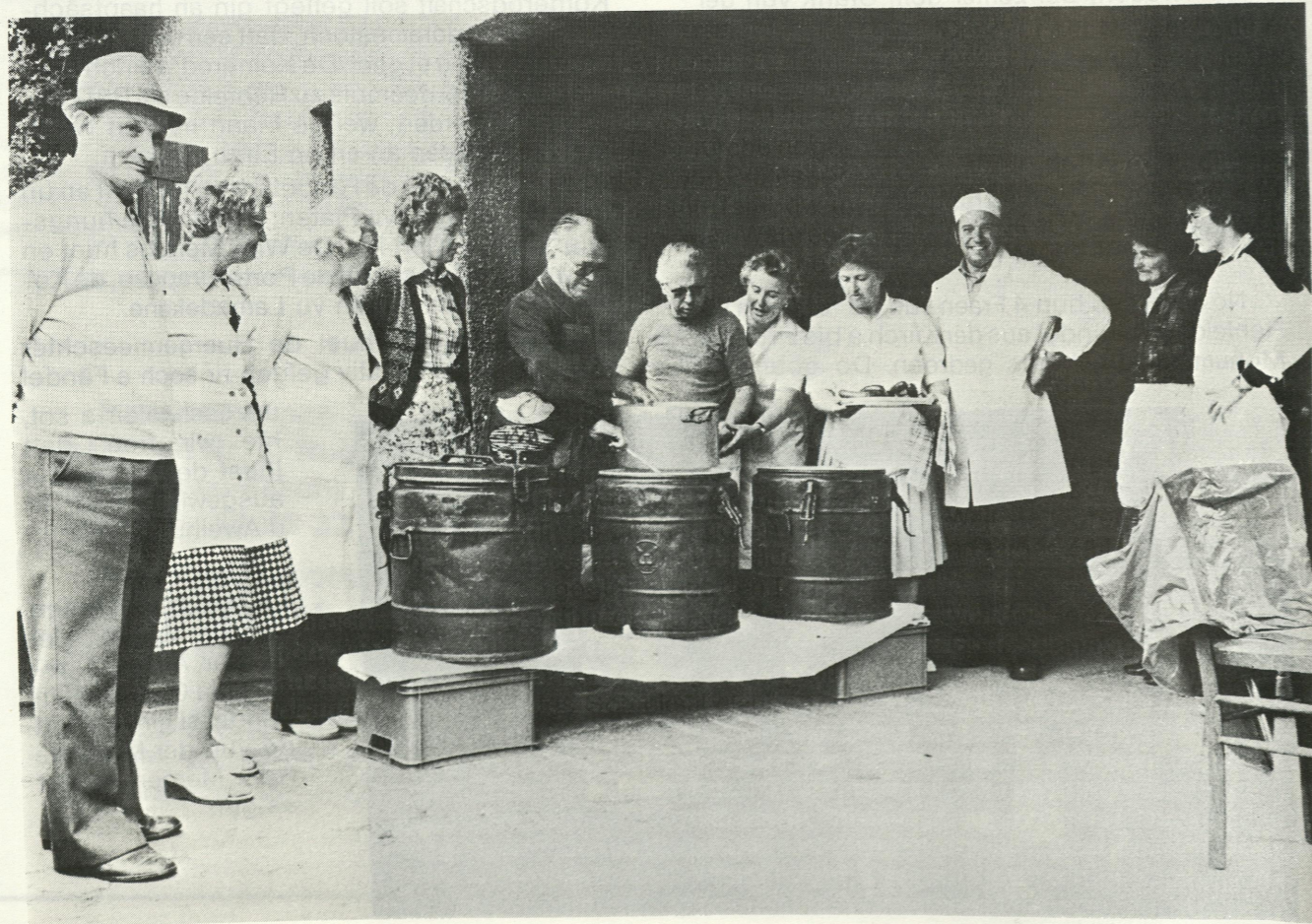
12 Les Sacrifiés 14 Les Sacrifiés

Unsere 211 Teilnehmer plus mehr als 30 Helfer aus dem Escher Komitee nebst Ehefrauen und anderen hatten ihrerseits „Sonne im Herzen mitgebracht“, ein weiterer Faktor, der zum Gelingen der Organisation beitragen sollte.