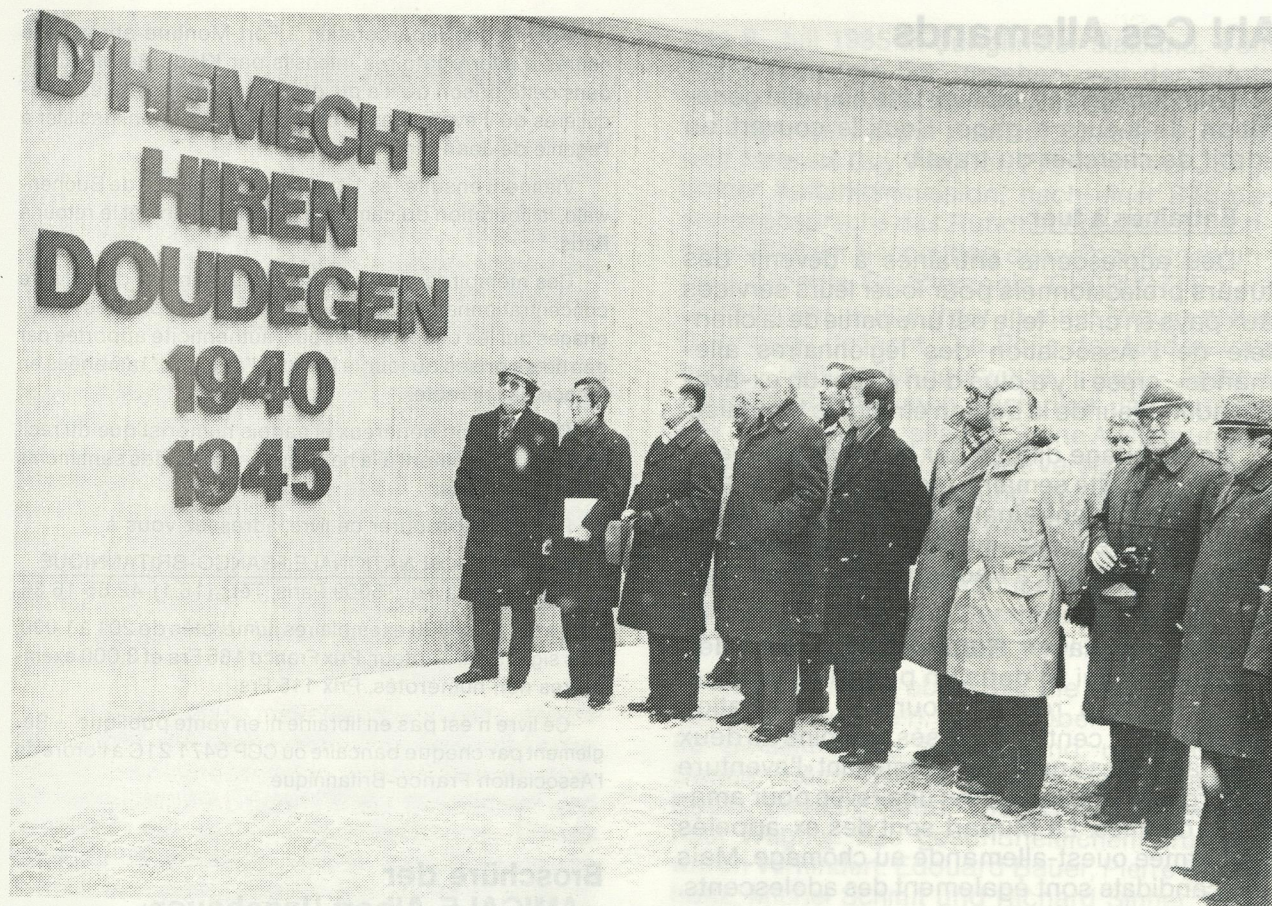
3e à partir de la gauche: le général Cheng-Wei-Yuan