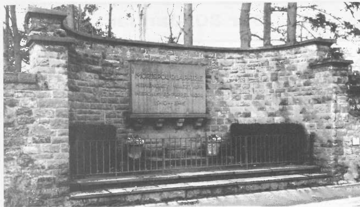
Monument aux Morts zu Heeschdréf.

Fünf Einwohner waren im KZ und Gefängnis eingeliefert, an den Orten mit berühmten Namen, wie Hinzert, Mauthausen, Sachsenhausen-Oranienburg, Dachau, Bergen-Belsen und Buchenwald. In Gefängnissen, wie Grund, Trier, Köln, Rhein-