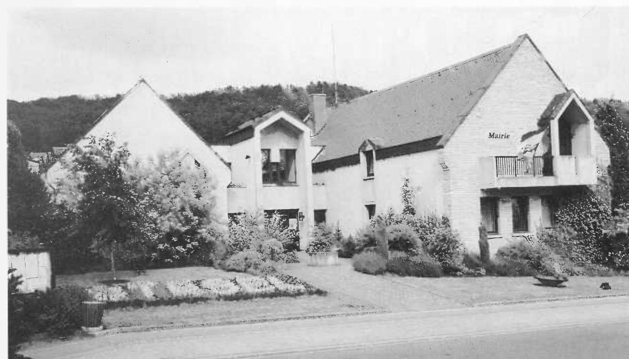
Märei vu Stesel.