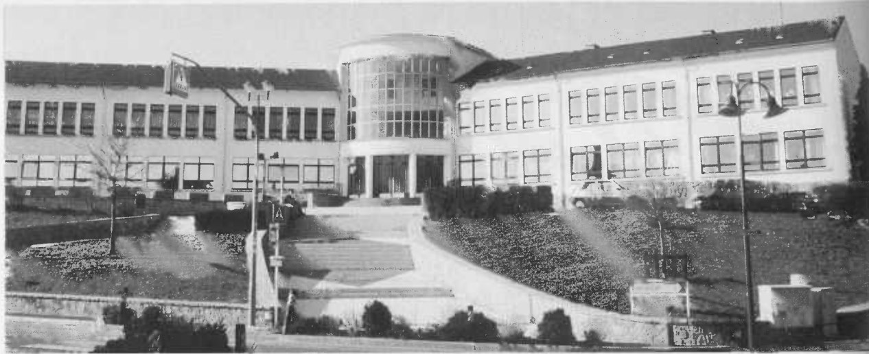
De Steseler Schoukplex an dem senge Reimlechketen de Kongress ofgehale gët.