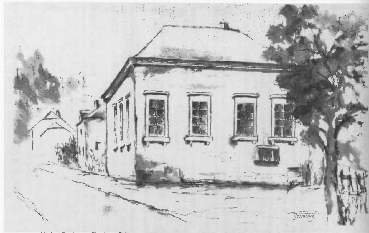
Michel-Rodange-Platz – Déi aal Schoul, wou den Michel Rodange virun 150 Joër seng éischt Schoulmeeschterplaz ugetratt huet.