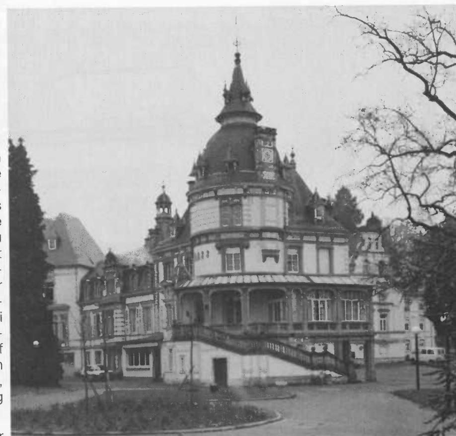
D'Schlass zu Heeschdréf vun den Doctrines Chrétiennes.