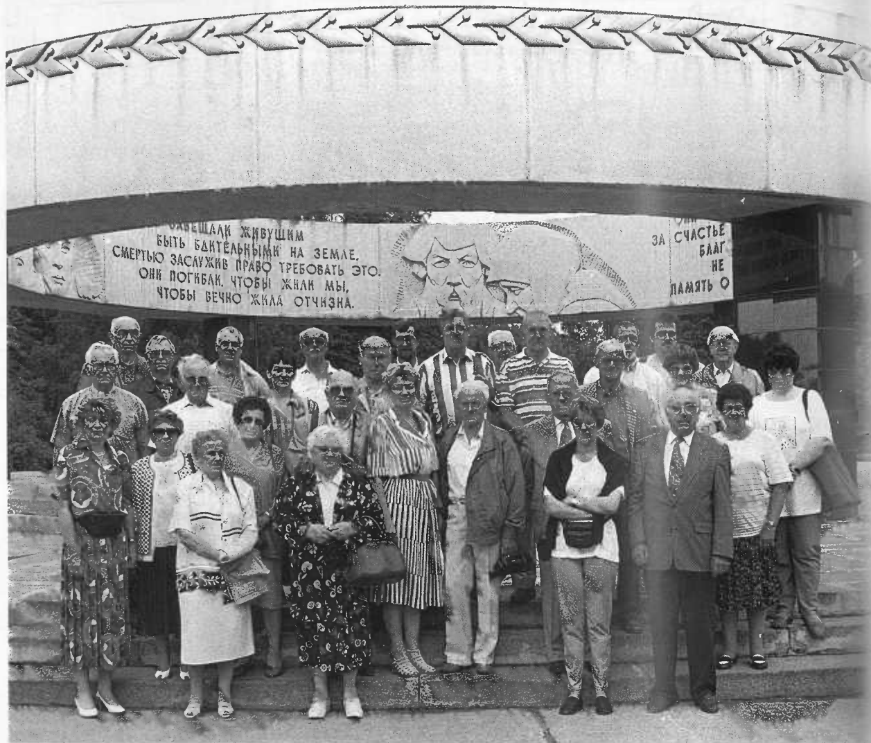
Die Reisegruppe aus Luxemburg nach der Gedenkminute vor dem Mahn- und Ehrenmal der Stadt Tambow. Dieses Denkmal erinnert an die 15 000 Gefallenen der Stadt und des Gebietes Tambow während des „Vaterländischen Krieges“ 1941-1945“.