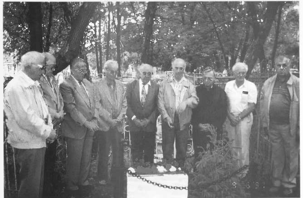
„Ehemalige“ in stiller Einkehr vor der Gedenkplatte mit in Bronze gegossener Aufschrift: „Le Grand-Duché de Luxembourg à ses fils enrôlés de force – victimes du nazisme“, in einer Ecke des Peter-und-Paul-Friedhofs, wo in einem eingefriedigt? ebenfalls Kriegsgefangene beerdigt wurden.