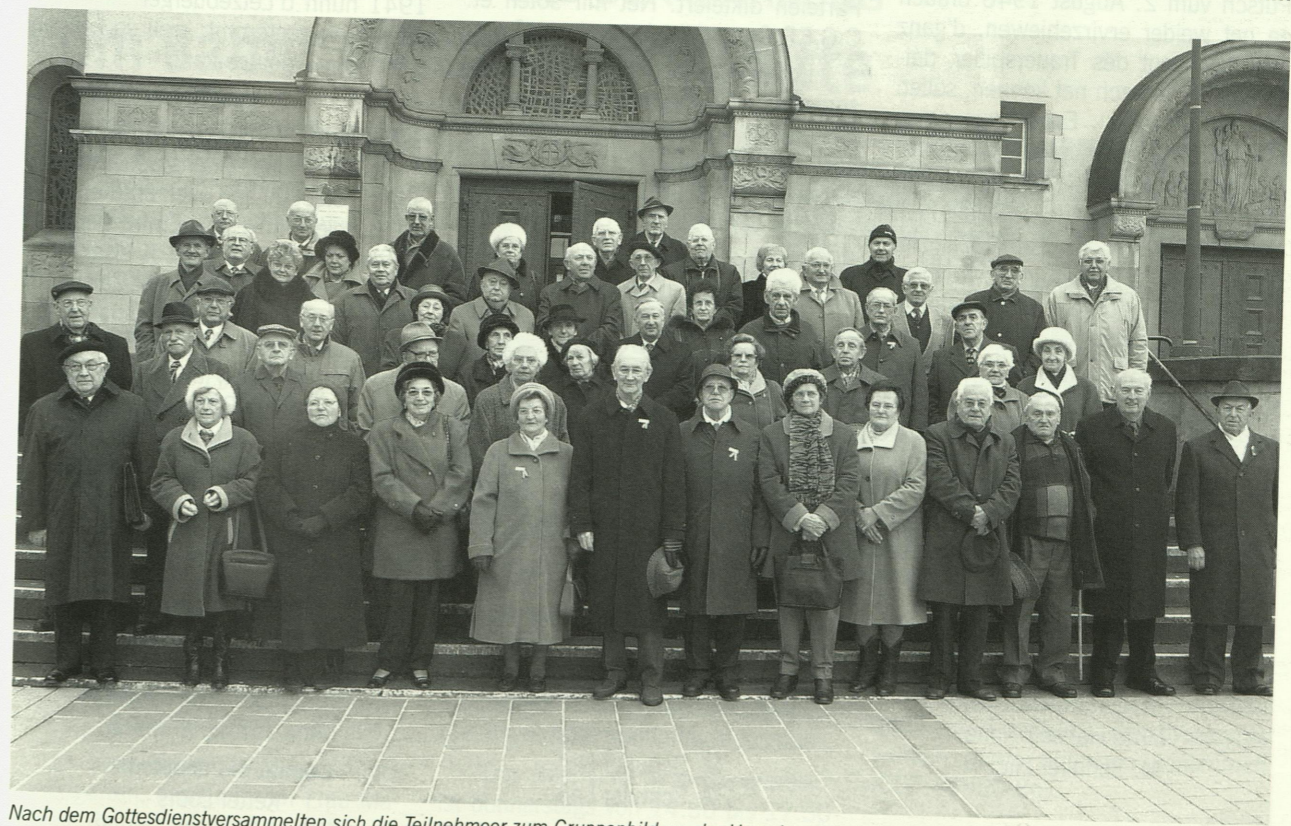
Nach dem Gottesdienstversammelten sich die Teilnehmer zum Gruppenbild vor der Herz-Jesu-Kirche