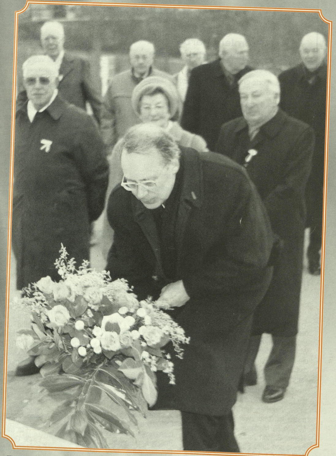
7. Dezember 2002: De russesche Gesandten, Seng Exzellenz Youri Kapralov léet Blumen nidder bei der éiweger Flaam um Kanounenhiwel, zesumme mat de Komeroden vum 7. Dezember 1945

Bulletin bimestriel de la Fédération des Victimes du Nazisme enrôlées de Force