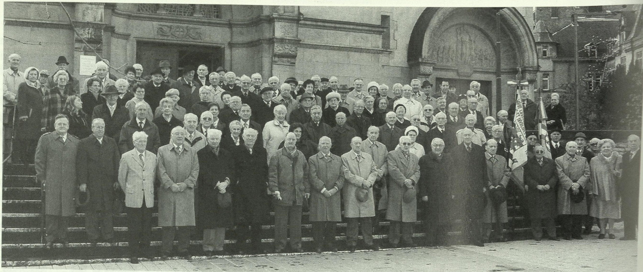
Zahlreiche „Tambower“ sowie deren Familienmitglieder hatten sich zum Gruppenbild vor der Herz-Jesu-Kirche versammelt. Ein ausführlicher Bericht über den Tag der „Tambower“ folgt in N°1 Februar 2003