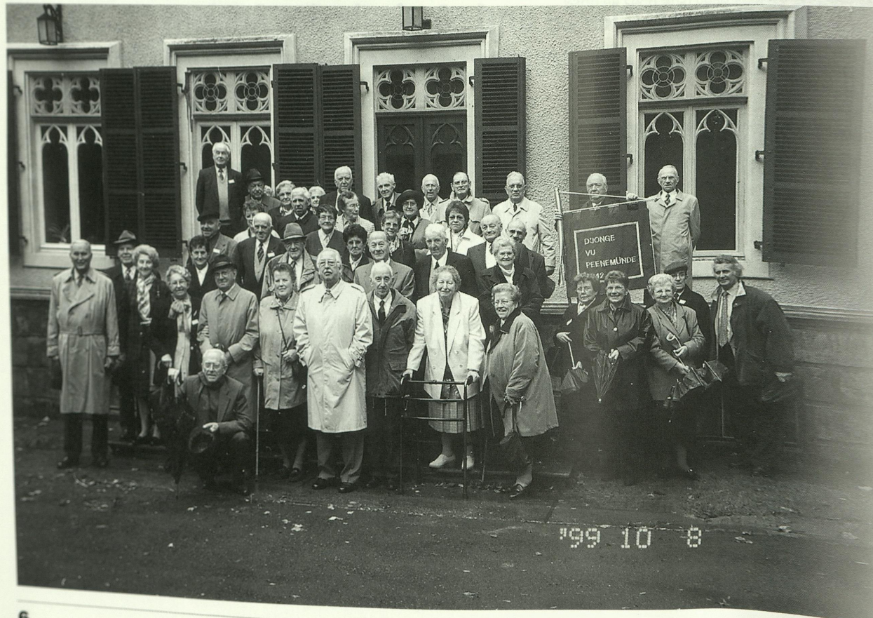
Les Sacrifiés 6/99