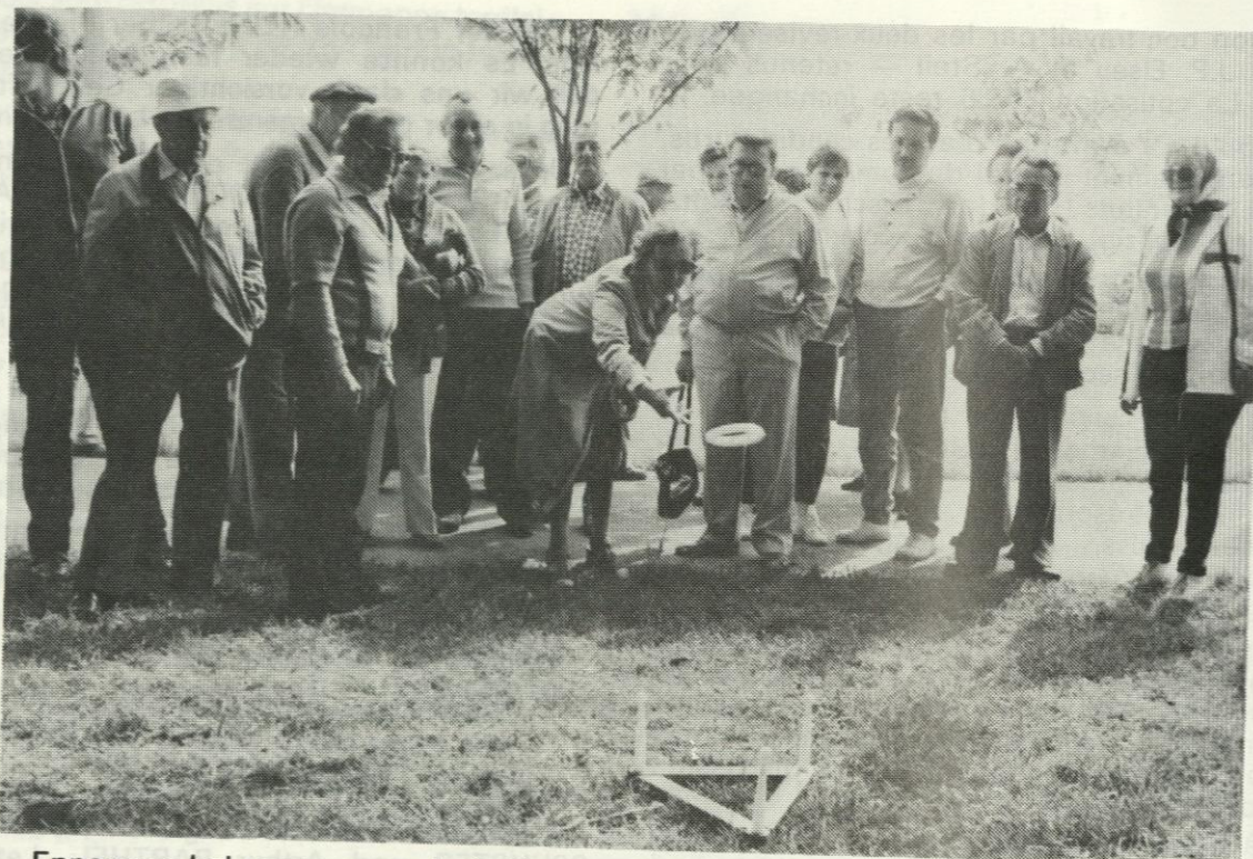
Ennerwee bei engem vun de Spiller, wou et gëllt mat Geschéckerlechkeet d'Ponktenzuel fir d'Endklassement an d'Luucht ze schrauwen. A bee jo! Da bonne Chance Madame ...