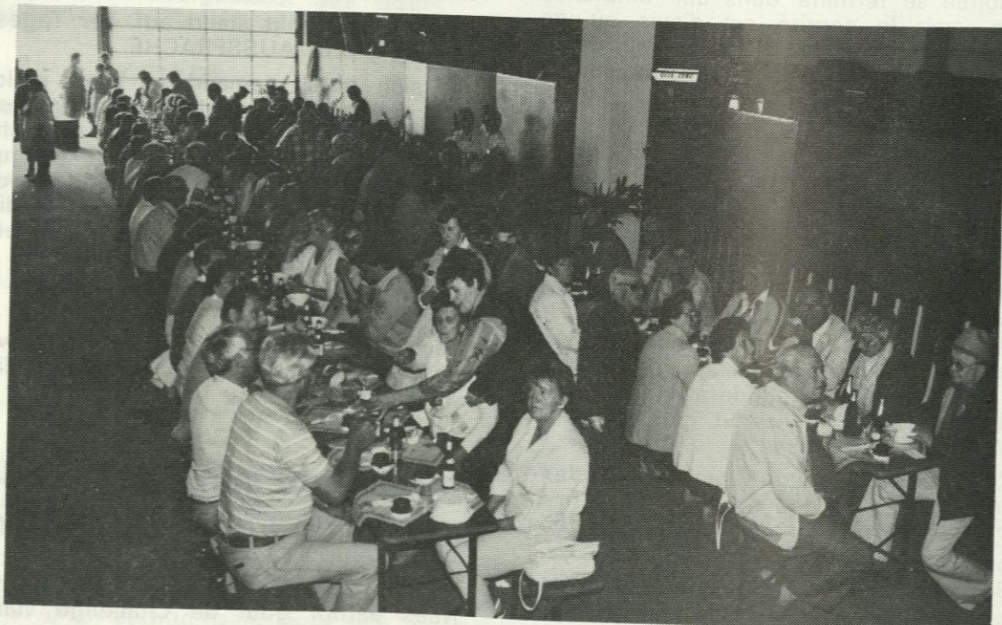
E Bléck an d'Hal vum Centre Omnisports zu Zolver. Do waarde se, mat de Féiss ënnert den Dëscher, bis den Ierzebulli servéiert gëtt.

Leit? Ma gewëss! Der waren der och eng helle Wull op Zolver kom. Net manner wéi 37 Equipe waren ugetrueden, eppes weider wéi 250 Persounen, fir ze probéieren, de Challenge vun der Fédératioun ze gewinnen. De Parcours vum Tréppeltour war gutt ausgewielt, en etlech honnert Meter méi laang wéi 5 Kilometer. Wierklech ideal. An e gong sech gutt. Datt