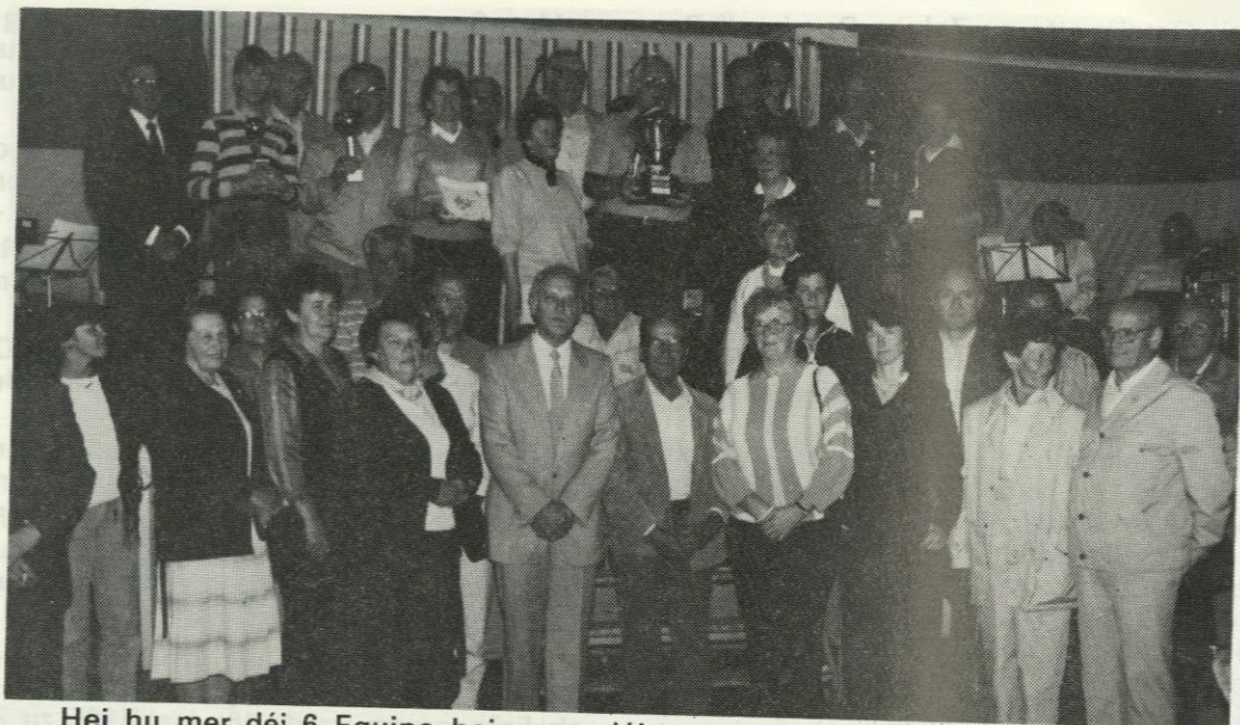
Hei hu mer déi 6 Equipe beieneen, déi eng vun de Coupe gewonnen hun.