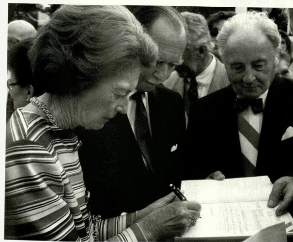
Le Grand-Duc Jean et la Grande-Duchesse Joséphine-Charlotte signent le livre d'or des enrôlés de force à Ettelbruck le 25 juin 1995