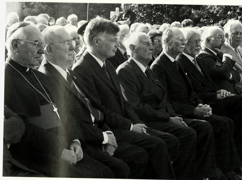
Neben Großherzog Jean hatten sich gestern noch viele weitere hochgestellte Persönlichkeiten auf dem „Kanounenhiwwel“ eingefunden