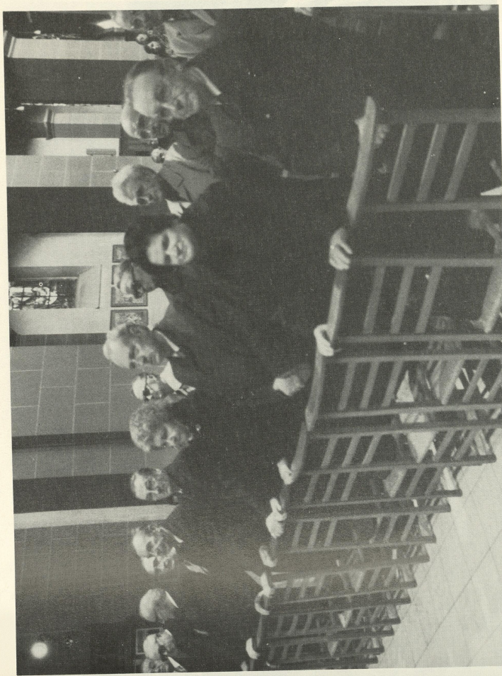
trag, zog wie ein Film an meinen Augen vorbei als ich zusah, wie am vergangenen 6. November die Überlebenden des Tambower Kriegsgefangenenlagers sich vor der Herz-Jesu-Kirche in Luxemburg versammelten, um einem Gedenkgottesdienst beizuwohnen, welcher um 10 Uhr

Mitzerleben, wenn die alten «Plennis» sich zu ihrem jährlichen Rendez-vous einfinden, d.h. jene 56- 62-jährigen Luxemburger, die nach langer Odyssee und qualvollen Erlebnissen, als Folge der von den Deutschen niederträchtig verfügten Zwangsrekrutierung, in russischer Gefangenschaft landeten, ist immer wieder zutiefst beeindruckend. Hier zeigt sich ganz frappant, daß Freundschaft, geschlossen in Zeiten schreienden Elendes, am längsten hält. Beim Anblick dieser Männer erinnert man sich unweigerlich an die kalte Nacht vom 5. November 1945. Es war 2.30 Uhr als der Zug aus Brüssel kommend im Bahnhof Luxemburg einfuhr und rund 600 ausgemergelte und zum Teil in Lumpen gehüllte Gestalten den Wagen entstiegen. Jeder, der damals dabei war, fragte sich «Herrgott! Sin dat do eis Jongen?» Was sich an nur spärlich beleuchteten Bahnhofsgebäude zu-