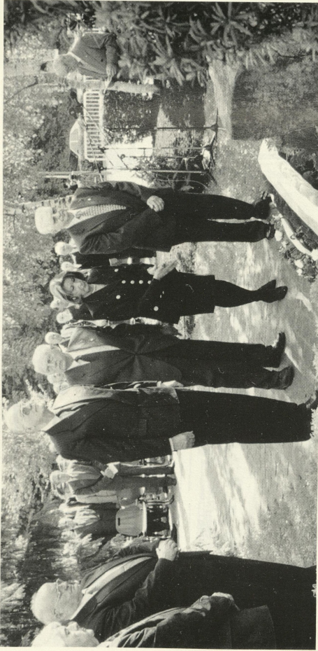
De 29. Mee 1996 as de Mémorial de la Déportation op der Gare vun Hollerech (Zwangskrutéierung an Emsdilling) ageweicht gin. Weinst dem übleche Marktum u Platz am Bülletin, hei jhust ee Bild vun der Inauguration mat dem Versprechen, dass de Rapport dorwäert an der nächster Nummer publizéiert gët.