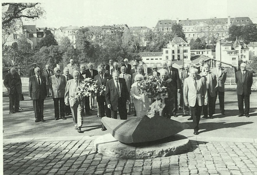
Blumme néierleeën um Kanounenhiwwel virun der Oktavmass...