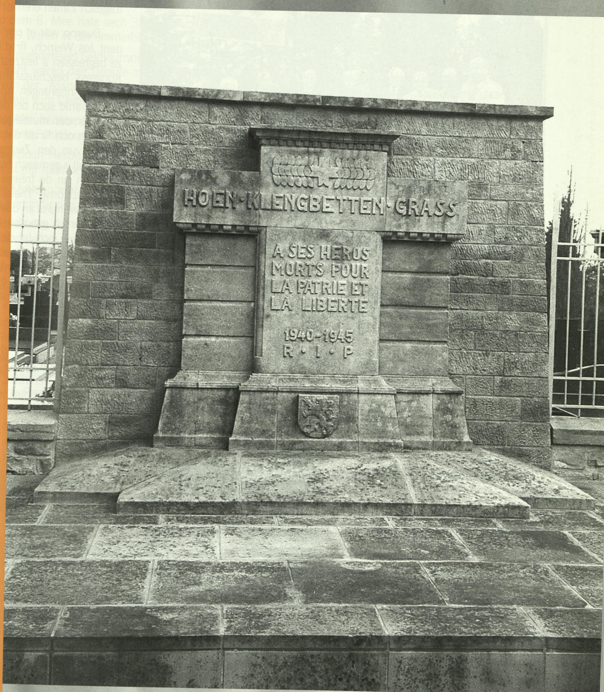
Monument aux morts HOEN - KLENGBETTEN - GRASS

Bulletin bimestriel de la Fédération des Victimes du Nazisme enrôlées de Force