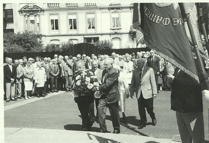
...a Blummen néierleeën no der Oktavmass bei der „Gëlle Fra“