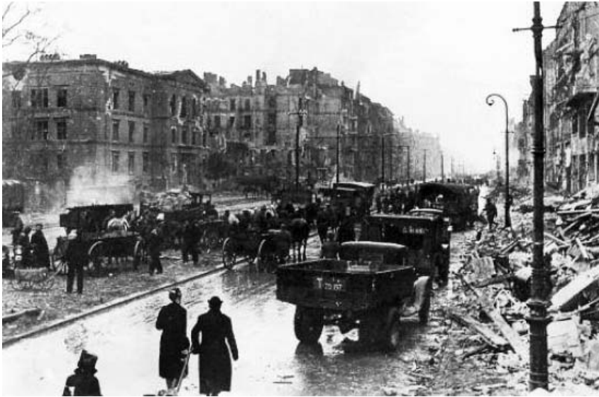
Nach der Schlacht in einer Großstadt