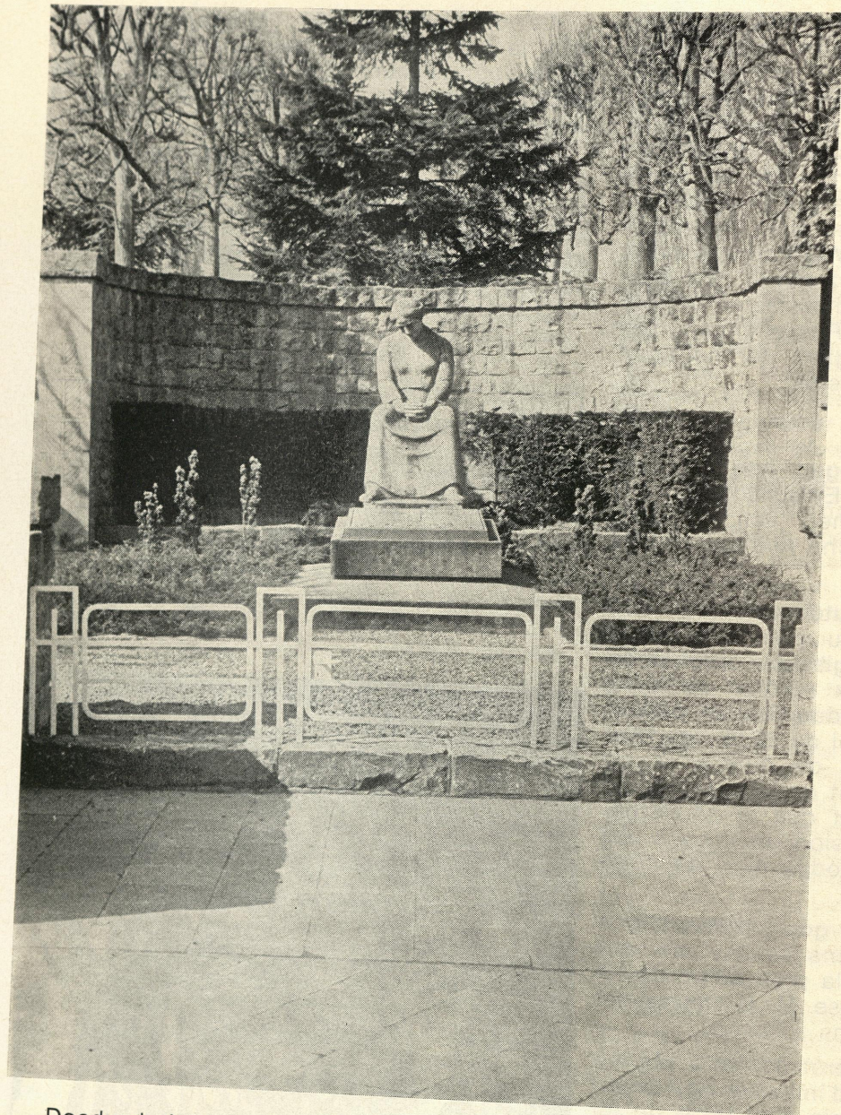
Monument aux Morts Rodange