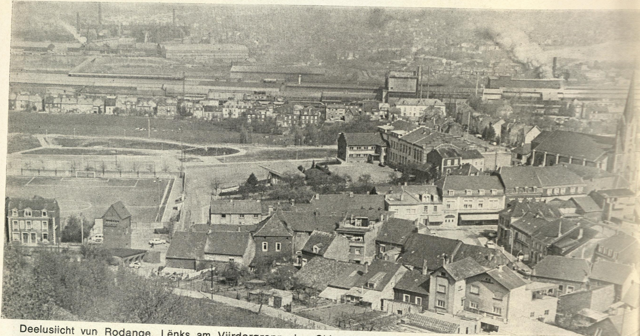
Deelusicht vun Rodange. Lénks am Viirdergronn den Chiers-Terrain. Op der Plaatz stong den 1. Mee 1942 e groust Zelt, wouran déi am Artikel beschriwen «Großkundgebung» vun de Preise war.

Zum Ofschloss hésche mer all eis auswärtig Komerooden a Gäscht h'ärzlech wöllkomm