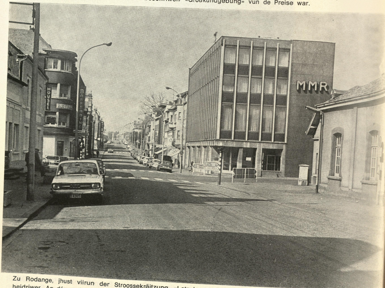
Zu Rodange, jhust viirun der Stroossekräitzung «Letzebuurg-Lonkeg an Athus-Déiferdeng», bitt sech daat Bild heidriwer. An dem neie Gebei mat de Buchstaven MMR, der «Maison Sociale», gët de Kongress oofgehalen.