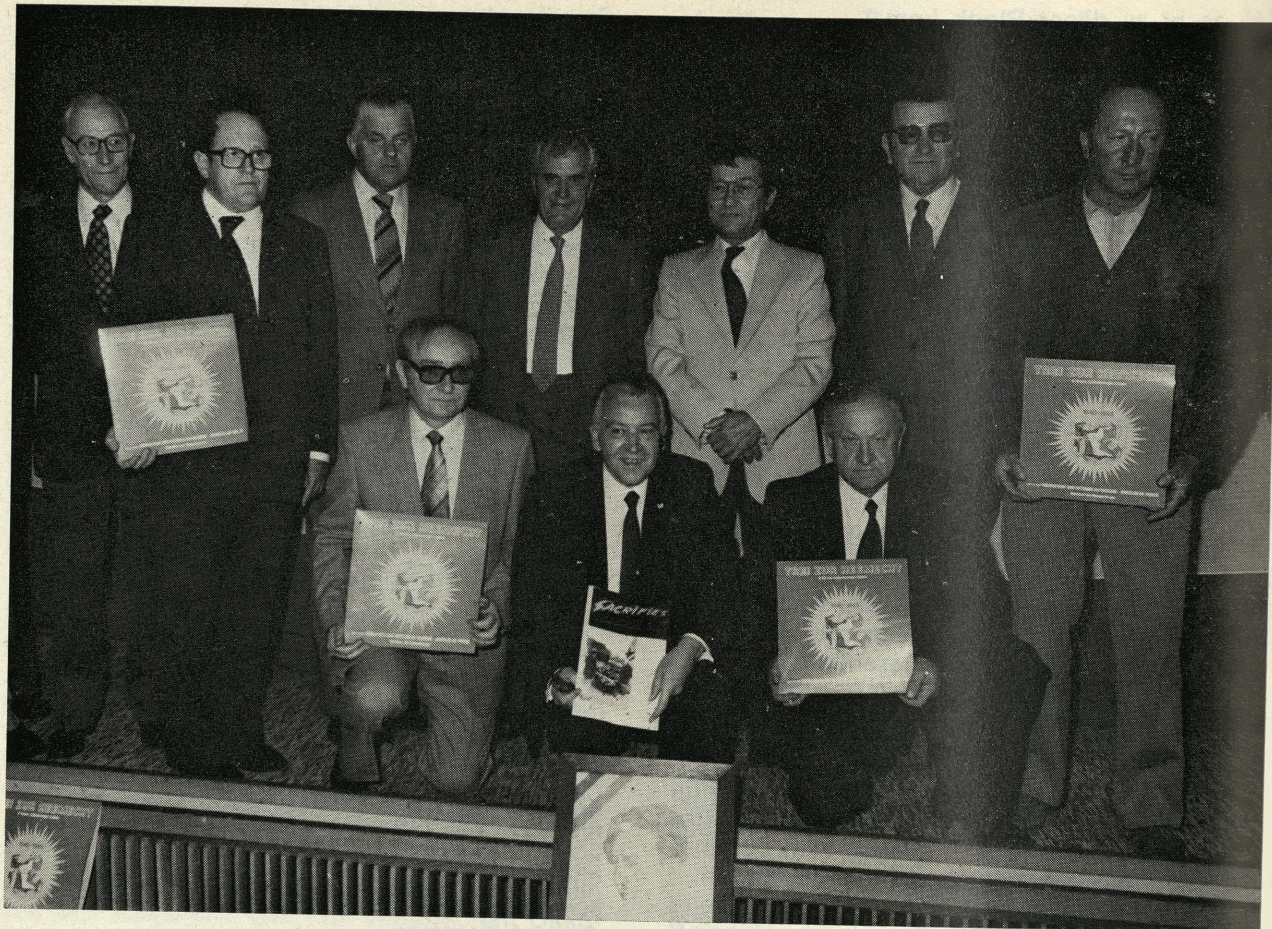
Eis Hesper Komeroden fréen sech. Hir Méi an Arbecht huet zu enger Réussite gefouert. Mir gratuléieren.