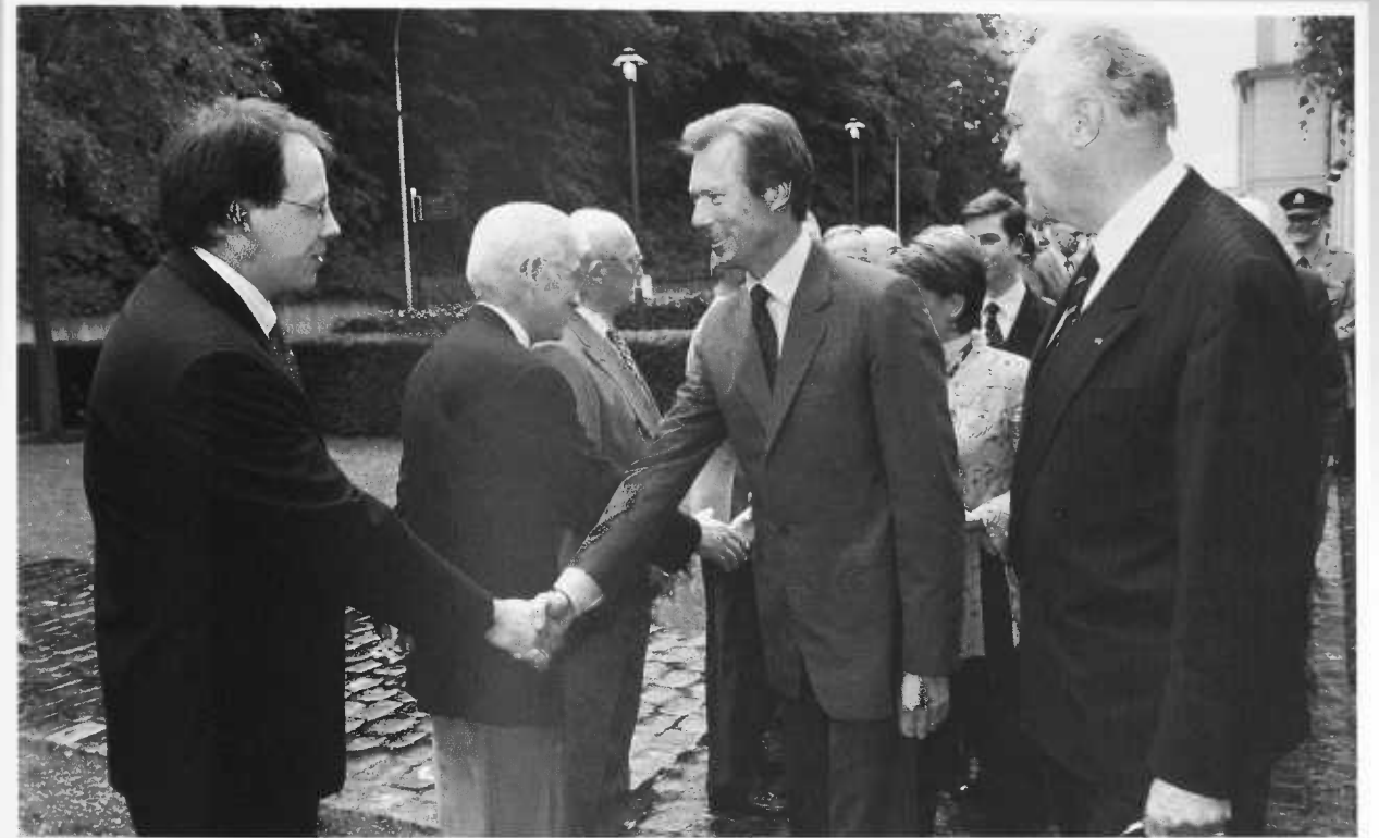
Erbgroßherzog Henri begrüßt die Mitglieder des Verwaltungsrates