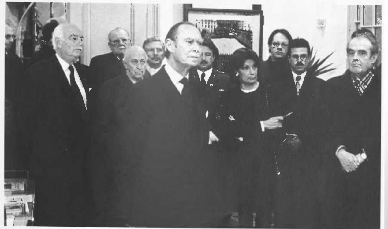
Großherzog Jean, umgeben von Mitgliedern der Resistenz-Organisationen und Mitgliedern der Stiftung des „Mémorial de la Déportation“.