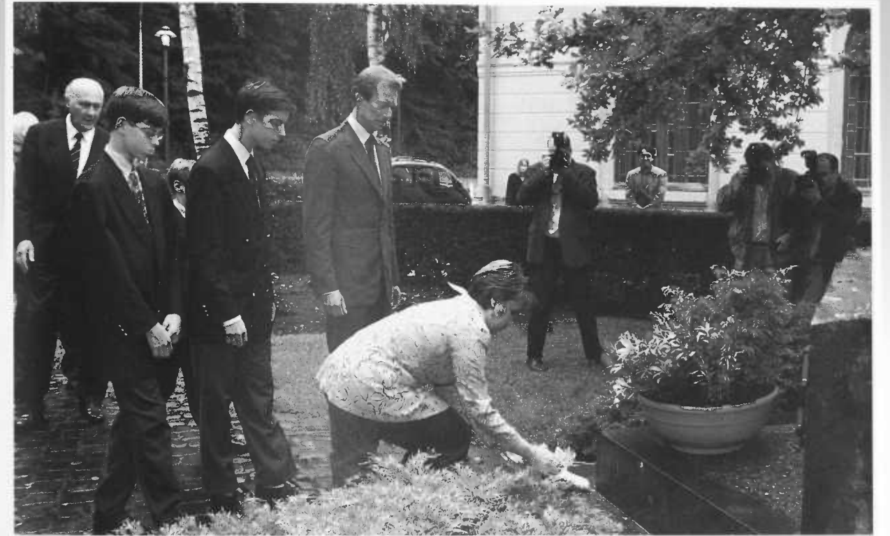
Erbgroßherzogin Maria Teresa legt ihren Blumenstrauß am Fuße des Gedenksteines nieder