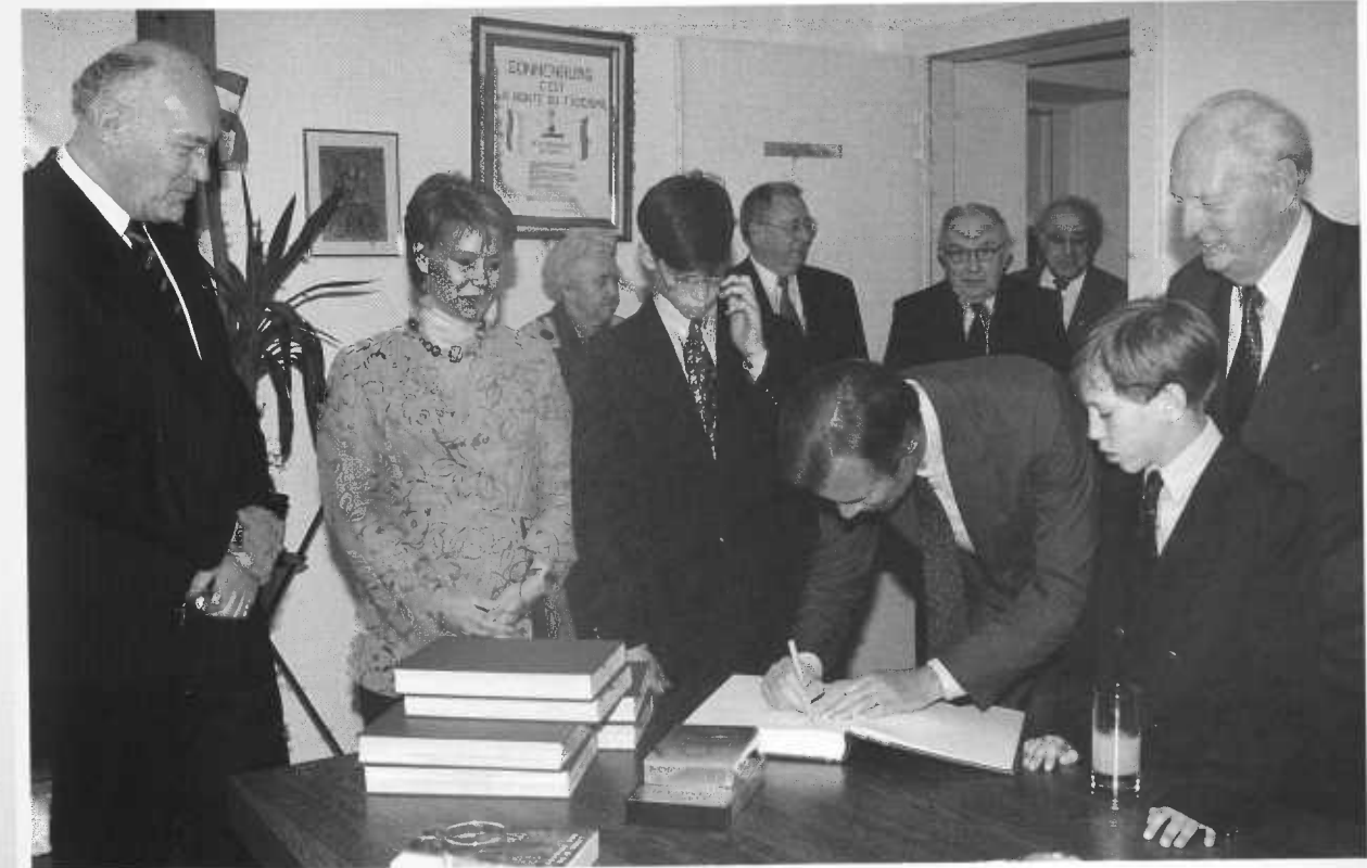
Die Erbgroßherzogliche Familie bei der Unterzeichnung in das Goldene Buch