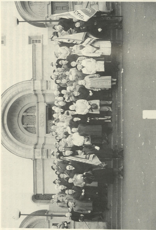
Ein Bild wie dieses wurde bei jedem Treffen unserer Tambower an gleicher Stelle gemacht. Besieht man sich die der Vorjahre, etwa die von vor 10 oder gar 15 Jahren, dann stellt man ohne jede Mühe fest, daß die Reihen der Tambower sich arg gelichtet haben.

«Enrôlés de Force» und der «Mutilés et Invalides de Guerre», den Pfarrer der Herz-Jesu-Kirche und an die Meßdiener.