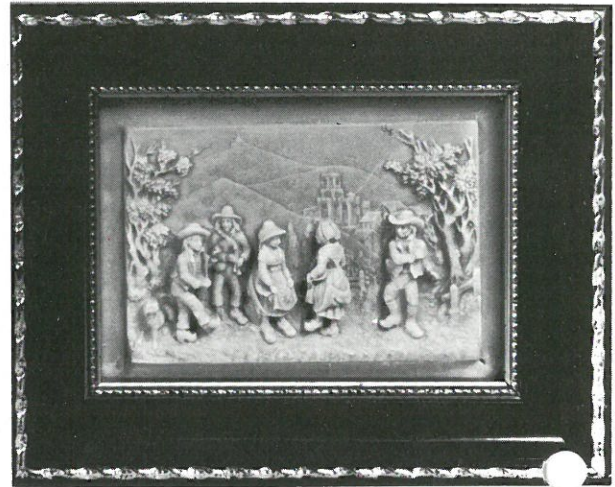
« Bourrée Auvergnate »

Vous vous étonnerez devant les plus petits détails figurant sur nos bas-reliefs, reproduisant souvent des scènes campagnardes, où paysans et paysannes en costumes du siècle passé se livrent à leurs occupations journalières : « la moisson », « les vendanges »... ou encore, ces instants privilégiés où l'on se réunissait autour de la table, près de l'âtre : « L'intérieur Auvergnat », « la veillée ». La teinte de ces tableaux fait songer à l'ivoire, tandis que leur translucidité, progrès récent, permet de réaliser des effets de perspectives ou de relief.