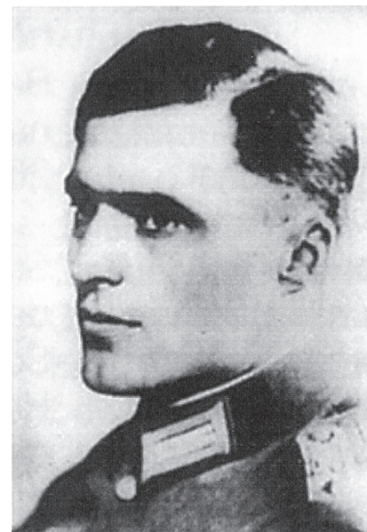
Der Kopf der Verschwörung: Oberst Claus Schenk Graf von Stauffenberg

Generaloberst Ludwig Beck wurde in seinem Büro im Bendlerblock zum Selbstmord gezwungen.