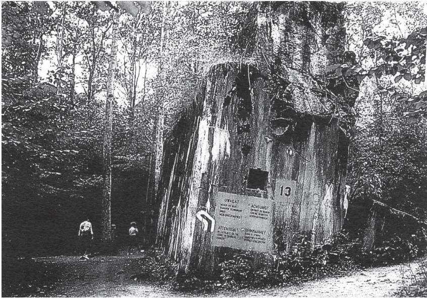
Die Südseite des Hitler-Bunkers in der Wolfsschanze heute.

Neuigkeit am Abend desselben Tages von einem ob des Fehlschlags höhnend triumphierenden Nazi-Vormann, der immer schon mit Sieges- und Rache- parolen zu entsprechenden Drohgebärden zu kompensieren versuchte, was ihm unter seinem jungen, auf Streichholzlänge zurechtgestutzten Blondschoopf fehlte.