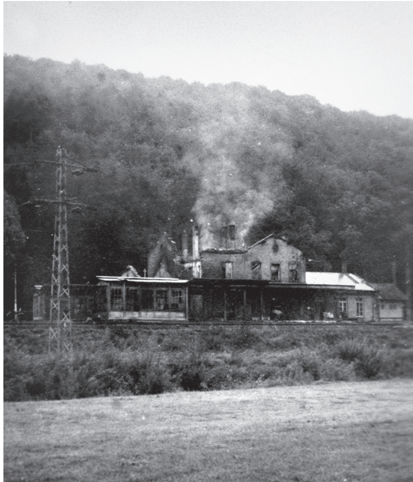
Brennender Bahnhof von Colmar-Berg

Als am 28. August gegen 9 Uhr der Personenzug aus Luxemburg in Colmar einlief, brausten drei Jabos im Tiefflug heran. Die Gefahr richtig einschätzend, koppelte der Lokführer seine Dampf-