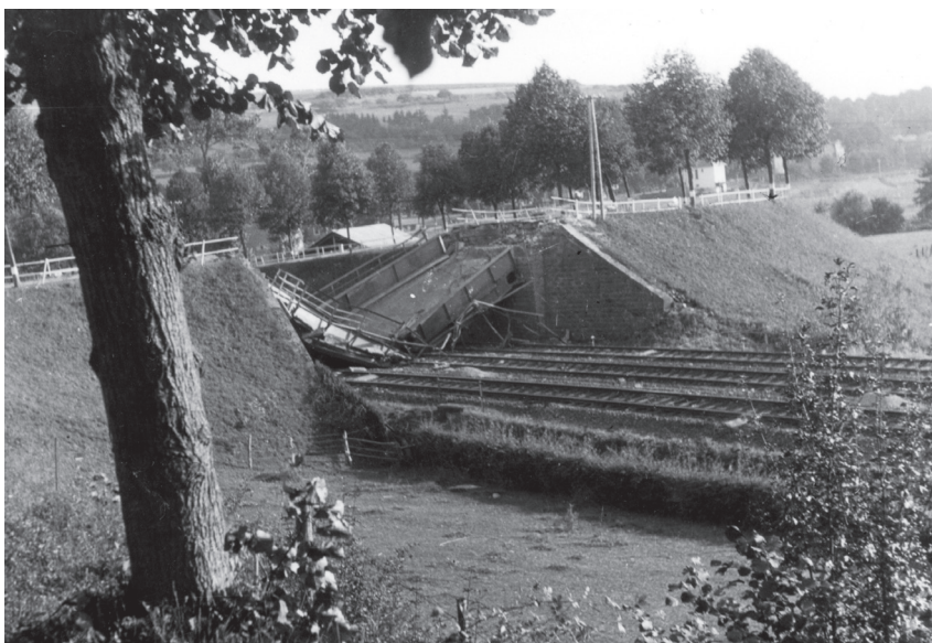
Die zerstörte Eisenbahnbrücke

Nic Wolff war Mitglied der Freiwilligenkompanie und kam wegen Ungehorsams nach Buchenwald. Am 4. Juni 1944 gelang ihm die Flucht mit Pierre Schaul, einem Belgier und einem Polen. Mit gestohlenen SS-Uniformen, bewaffnet mit Pistolen und einem SS-Wagen, passierten sie die Wachen und gelangten in die Freiheit. Der Pole war SS General und die drei andern lagen in Häftlingskleidern unter Decken versteckt im Wagen. Unterwegs wurden die Häftlingskleider gegen SS-Uniformen getauscht. Als der Sprit verbraucht