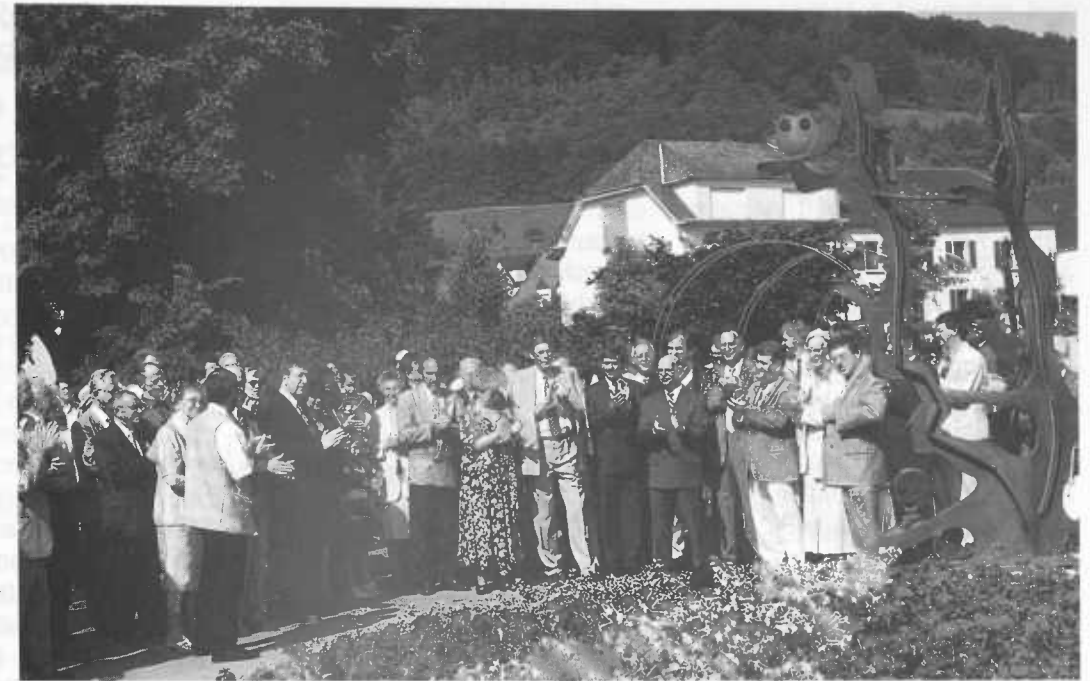
Neugestalteter Dorfkern nach Robert Krieps benannt.

„Och dësem gudde Jong hate seng Stopp ugebueden. Hien huet se refuséiert, an hien huet et virgezunn dat ongewësst Schicksal mat séngem Alterskomeroden ze deelen, an dat fir séngen Elteren a sénger Schwëster de Wee an d'Émsiiddlung ze erspüeren. Mee dat Schlämmst dat nëmmen konnt geschéien, as agetrueden, hie as a Russland verschleeft gin an hie säi Blut missen vergëisse fir en Saach, déi séng nit war. Elo läit hie