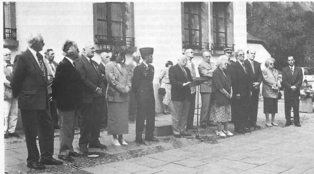
Einen Dank an die amerikanischen Befreier des zweiten Weltkriegs Clerv

... L'orateur rappelle la date du 10 mai 1940, aujourd'hui exactement 58 ans, où l'invasion et l'oppression des Allemands a commencé... Le départ des jeunes Américains sous les armes et l'enrôlement de force des jeunes Luxembourgeois étaient plus ou moins identiques, mais leurs sorts par contre étaient tout à fait différents, sauf pour tous ces pauvres malheureux qui ne sont plus rentrés mais qui possèdent le titre «Morts pour la Patrie». B. J. ne manque pas de condamner la mesure allemande de l'enrôlement de force des jeunes Luxembourgeois. Avec la libération, les plaies et blessures attendaient leur guérison. Aux yeux d'un grand nombre de mères pensives et anxieuses, le sort de leurs fils était incertain et inconnu. Une familiarisation s'établit entre les familles luxembourgeoises et américaines. B. J., après quelques réflexions sensibles, finit avec l'acclamation enthousiaste: les amis GI ne sont pas seulement nos amis, mais sont membres de nos familles luxembourgeoises!