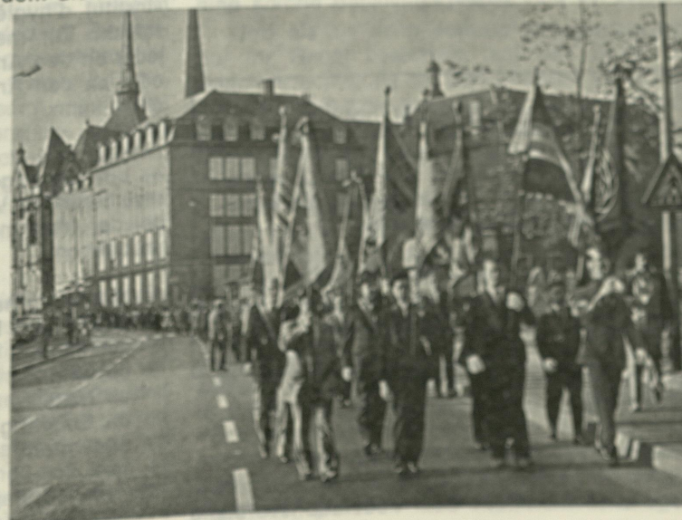
Les Sacrifiés 11