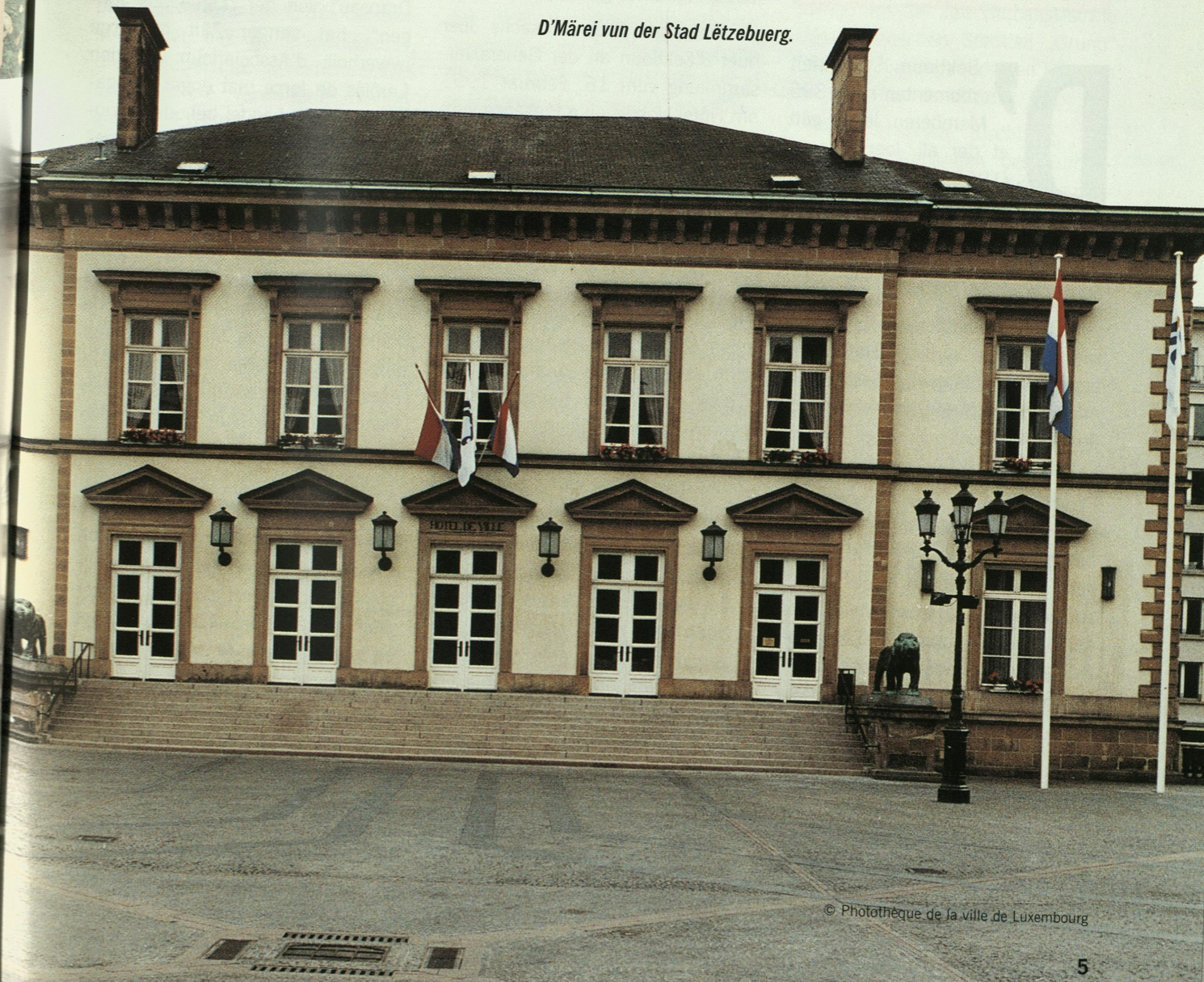
D’Märei vun der Stad Lëtzebuerg.