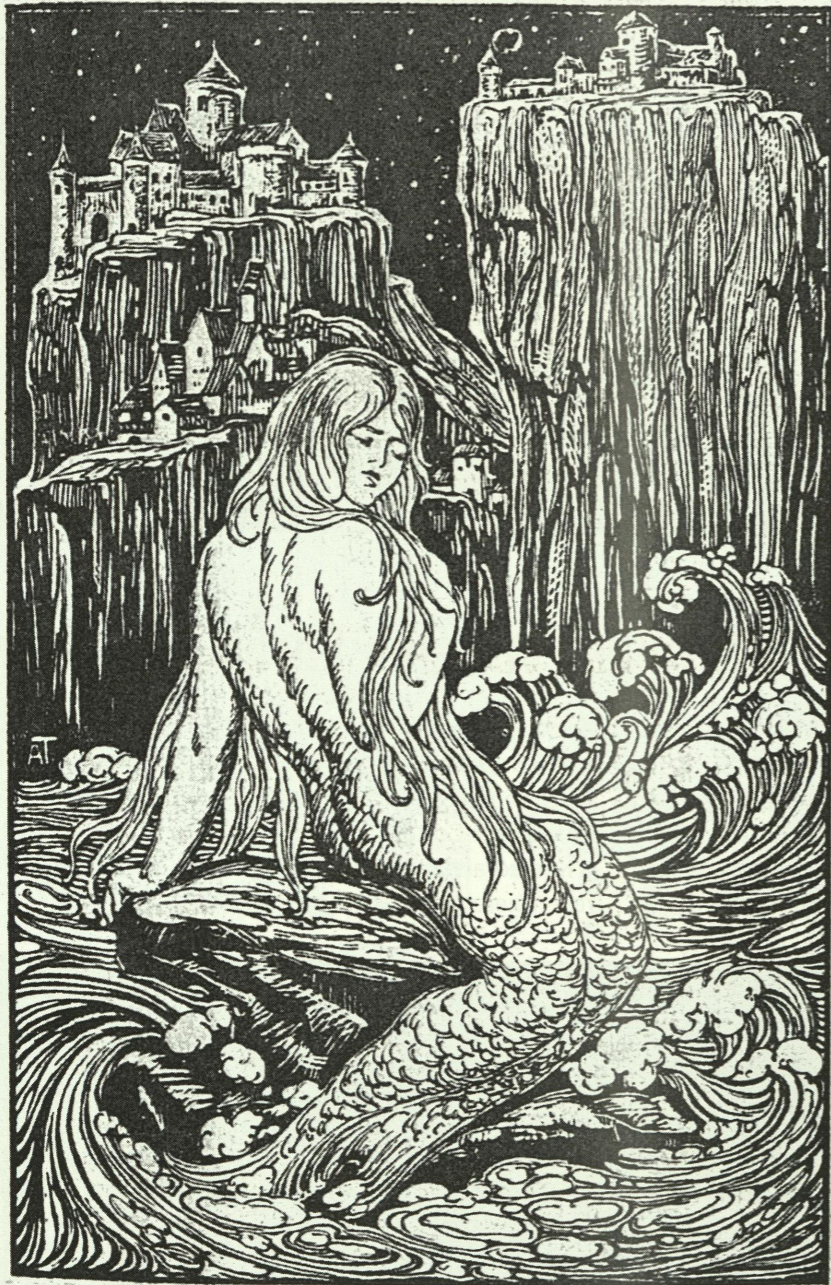
Luxemburgs Ahnfrau, die Alzettenymphe Melusina (Schnitt von Aug. Trémont)

Auf steilem Fels mit Turm und Tor Hoch strebt ein steinern Wunder empor: Rundum und tief in funkelnder Pracht Wölbt sich die Mond- und Sternennacht.