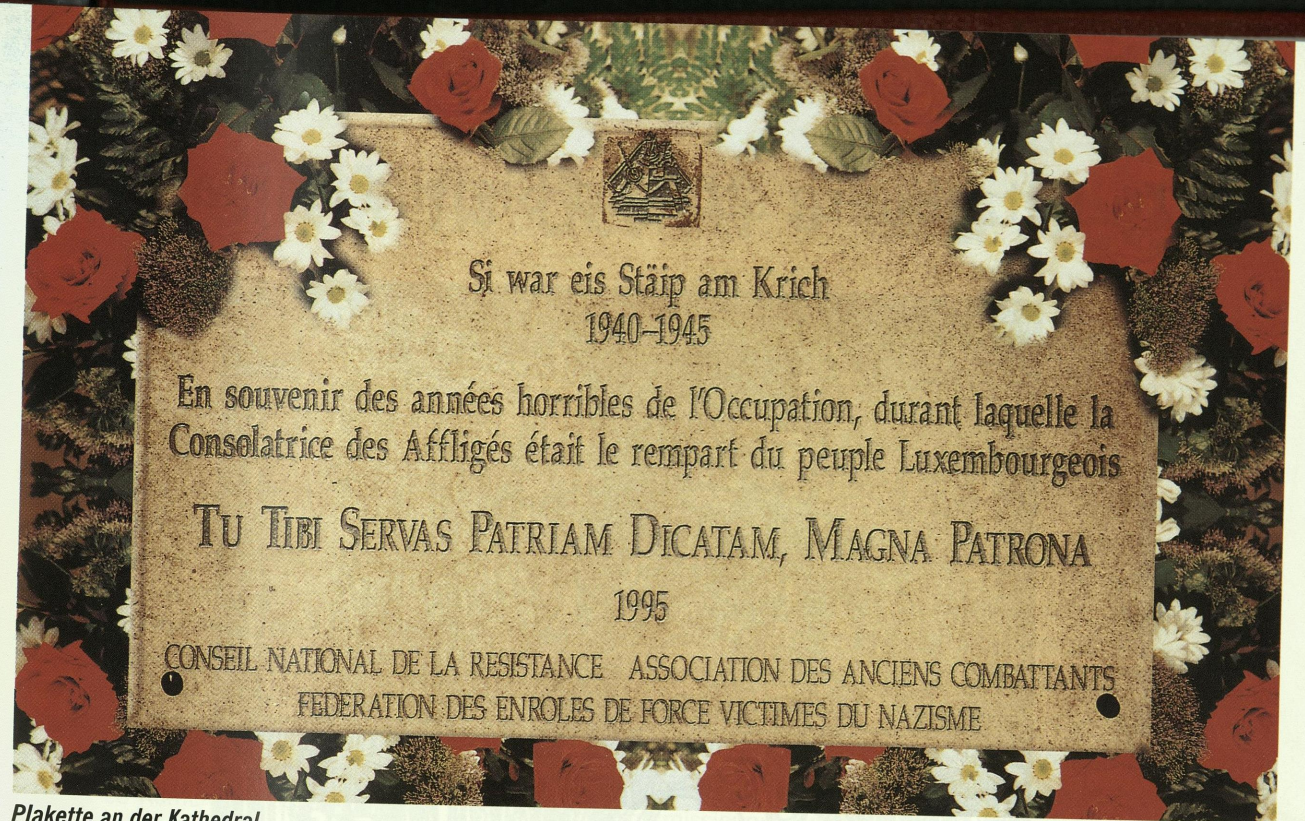
Plakette an der Kathedral