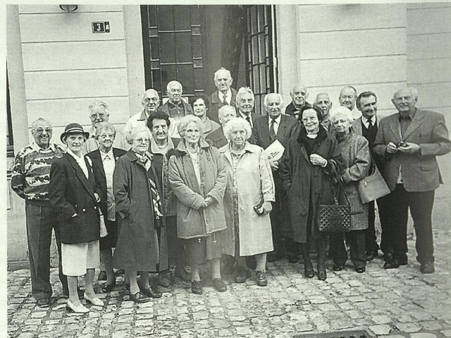
Visite vun der Sektioon Diddeleng am Mémorial vun der Déportatioun an der Expositioun „Irish Guards“