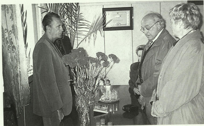
Empfang bei der Stadtverwaltung in Kirsanow