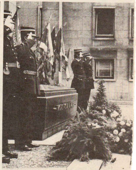
Auch in Esch/Alzette wurden Blumen am Totendenkmal am Resistenzmuseum niedergelegt, dies in Gegenwart von Isabel Allende, der Tochter des vor elf Jahren ermordeten chilenischen Präsidenten