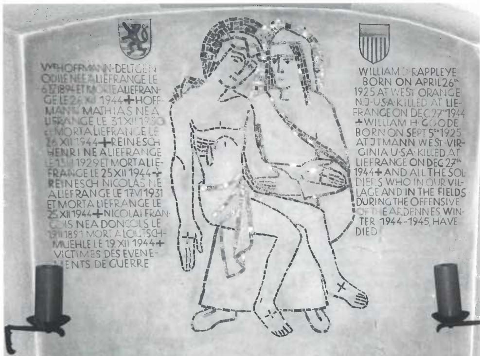
Denkmal in der Dorfkirche von Liefringen zur Erinnerung an die Kriegsoffer unter der Zivilbevölkerung der Ortschaft und an die dort gefallenen amerikanischen Befreier und deren Gegner.