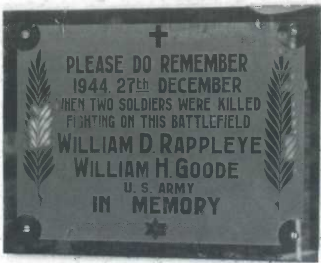
Erinnerungstafel am Giebel des „Marjaashaff“ in Liefringen, wo William D. Rappleye und William H. Goode am 27. Dezember 1944 den Tod fanden.