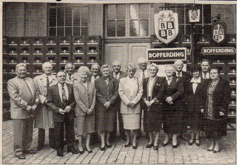
Zum 22. Mal trafen sich die früheren Zwangsrekrutierten aus dem Lager Rehfelden in Schlesien zu einer Wiedersehensfeier. Nachdem sie Blumen in Erinnerung an ihre verstorbenen Kameraden am „Monument aux Morts“ niedergelegt hatten, versammelten sie sich im Restaurant Colles zum Festessen.