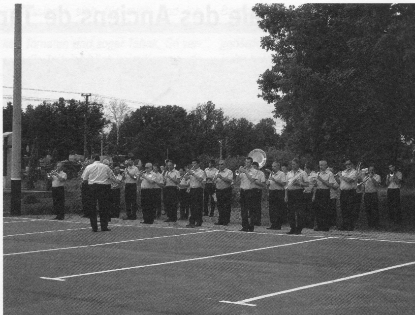
D'Autoritéiten ware sech net ze Schued, fir d'Gouverneurs Musek während der Gedenkzeremonie untrieden ze loossen