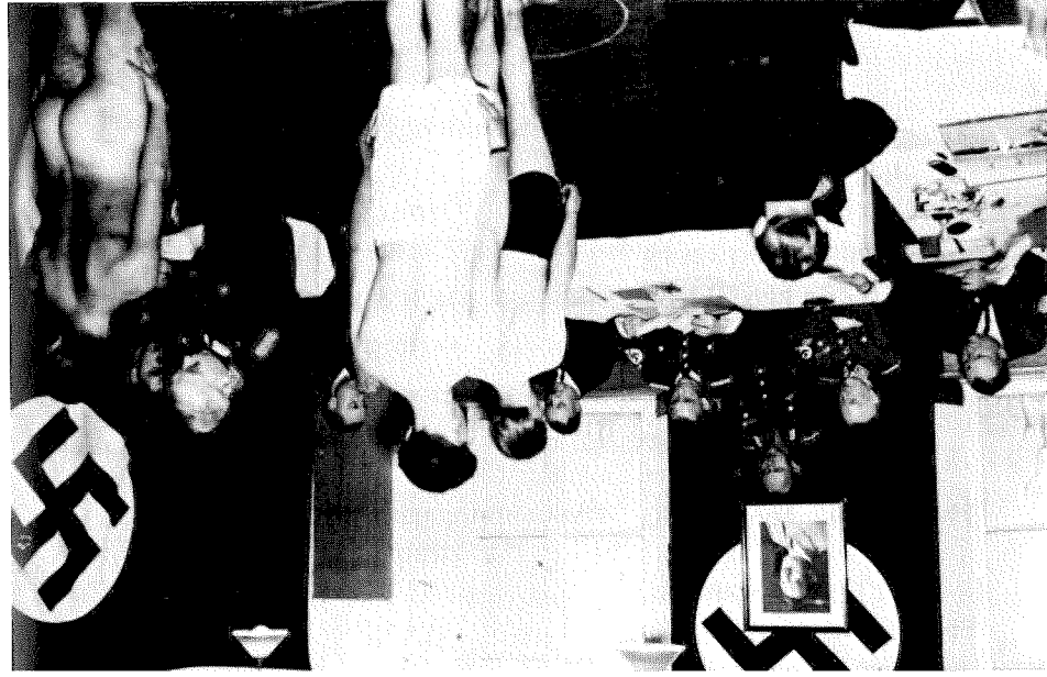
Musterung für den R.A.D.