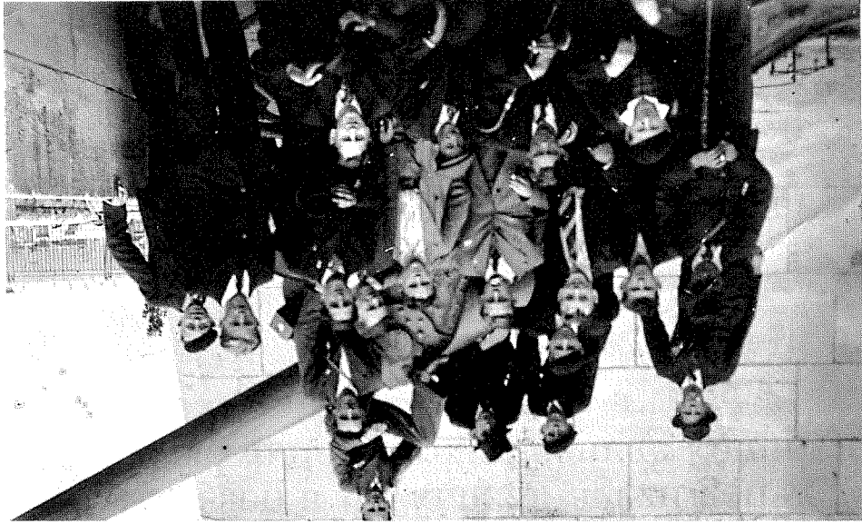
De Junglinsverain zu Verdun vtrum Krich