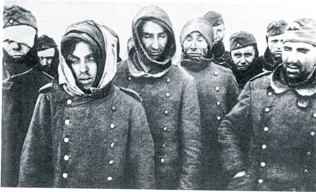
Prisonniers de guerre allemands

portements exemplaires dans les camps, ou encore des prisonniers affaiblis ou malades, incapables au travail. À la fin de l'année 1945, trois grands convois de rapatriement ramenèrent le gros des prisonniers luxembourgeois au pays. Suivaient de petits groupes, le plus souvent attachés à des convois de prisonniers d'autres nationalités. Toutefois, un nombre important de ressortissants du Grand-Duché demeura en URSS après 1945. Il s'avéra difficile de les repérer. Isolés dans la masse des prisonniers étrangers, ils ne disposaient souvent plus de pièce d'identité, ce qui leur faisait courir le risque d'être enregistrés sous une nationalité différente, et leur dispersion inévitable dans la masse des prisonniers sur le territoire soviétique ainsi que le grand nombre de camps de différents types ne facilitaient pas la tâche de repérage. En outre il arrivait que les Allemands, agissant comme intermédiaires entre les autorités et les prisonniers dans bon nombre de camps, substituent un des leurs à un Luxembourgeois prévu pour le rapatriement,