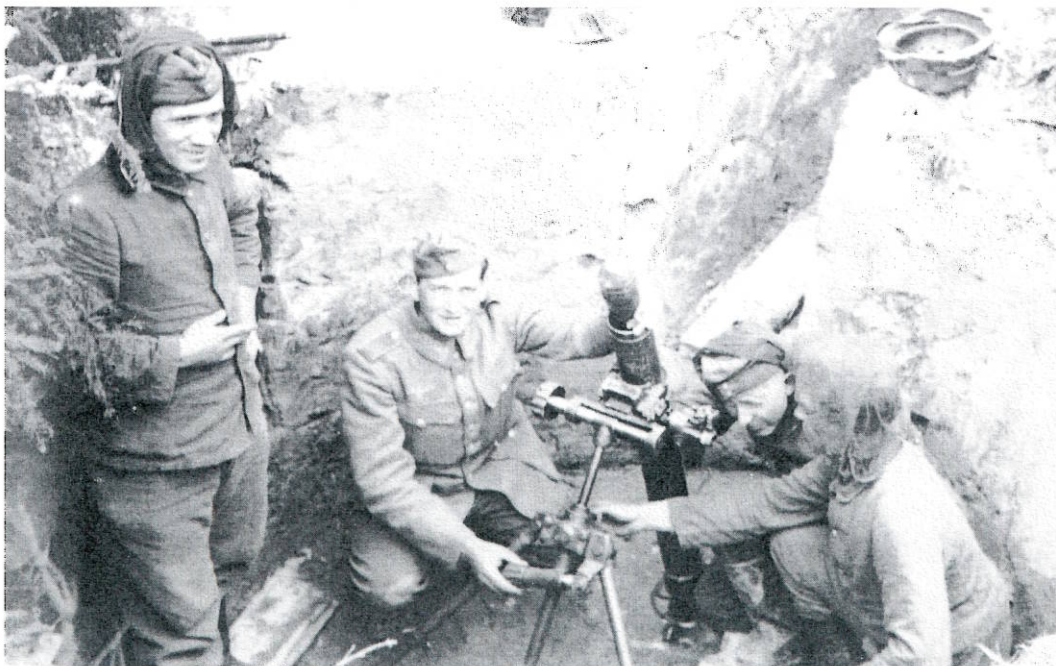
Enrôlés de force dans une tranchée