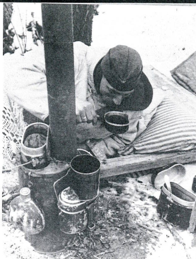
L'hiver au front de l'est, 22 février 1943

Une fois passés du côté soviétique, les déserteurs étaient souvent profondément déçus par l'accueil que leur réservaient les Russes. À de rares exceptions près, ces derniers ignoraient tout du Grand-Duché et les transfuges avaient bien du mal à expliquer leur situation. Au moyen de gestes et de quelques bribes de russe, ils essayaient de se faire comprendre, d'insister sur la proximité de leur pays avec la France et parfois ils en récoltèrent des petites faveurs. Souvent ils finissaient par se prétendre français. De longs interrogatoires, parfois extrêmement circonstanciés, s'ensuivaient sur le service militaire et la vie civile. D'aucuns, en désespoir de se faire comprendre, renvoyaient leurs interrogateurs à l'émission Liberté luxembourgeoise diffusée par la BBC et déclaraient leur désir d'être transférés en Angleterre afin de rejoindre une brigade luxembourgeoise auprès des Alliés. Les Soviétiques n'y prêtaient guère attention, il leur arrivait pourtant de proposer aux captifs le service dans leurs propres rangs, et certains prisonniers luxembourgeois, forts de leur connaissance des positions